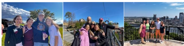
ファースト ホストファミリー